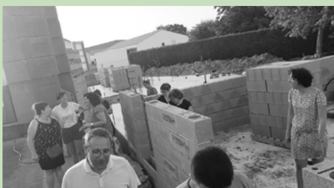
En juin, visite des travaux de la maison médicale avec l'ensemble des élus de La commune.