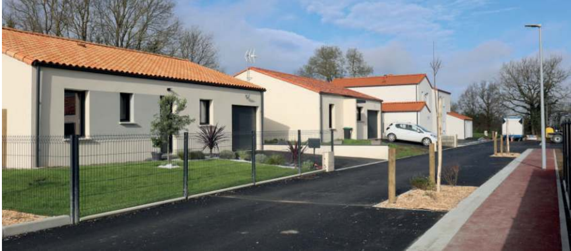
↑ Lotissement de La Canquetière