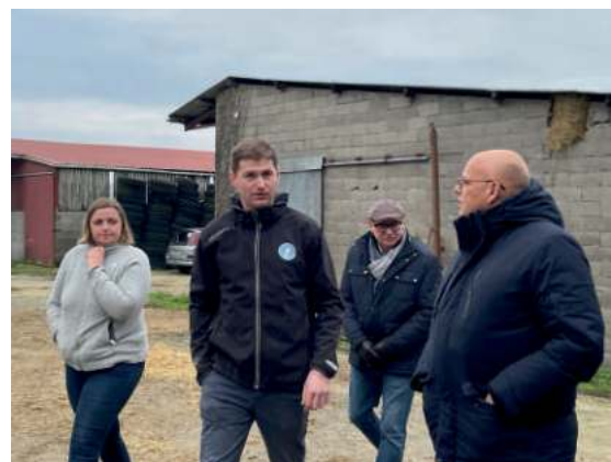
↑ Visite des élus au Gaec de l'Arche situé à La Guyonnière en février.

Pour l'édition 2024, 5 exploitations de Montaigu-Vendée seront visitées. Par ailleurs, les élus de Montaigu-Vendée visitent aussi régulièrement des fermes. La prochaine est prévue fin mai, à la ferme de la Souriterie.