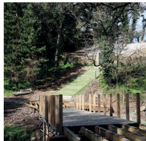
↑ Pour faciliter l'écoulement de l'Asson et poursuivre la renaturation du cours d'eau, le petit barrage existant a été supprimé et une passerelle en bois a été installée pour passer d'une berge à l'autre.

Le programme de l'ouverture du parc sera communiqué prochainement sur le site montaigu-vendee.com