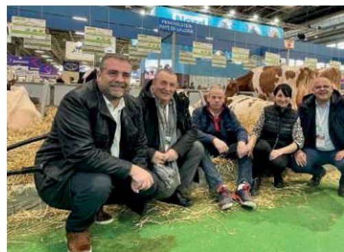
↑ Les élus aux côtés de l'EARL des Peupliers, situé à Saint-Hilaire-de-Loulay et participant au concours de la race Prim'Holstein lors du dernier Salon International de l'Agriculture.