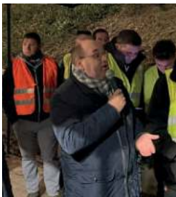
← Les élus à la rencontre des agriculteurs du territoire lors des manifestations du mois de janvier 2024.